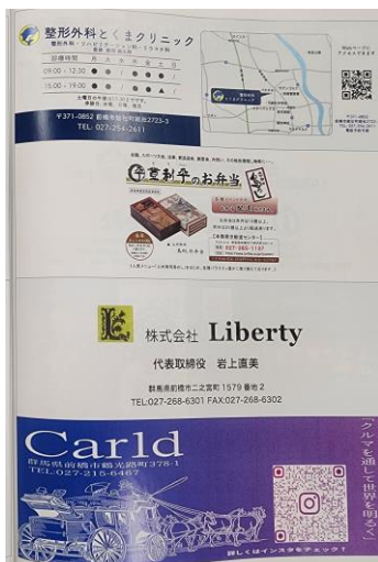
前回大会のプログラム